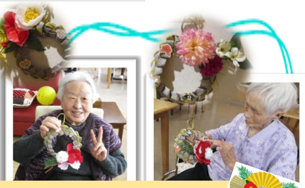
しめ縄制作しました