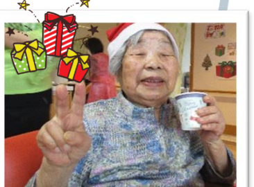
スタッフ余興の合唱では 利用者様も一緒に盛上がりました。 小さなXmas会でしたが笑い声は大きく とても楽しい会になりました。